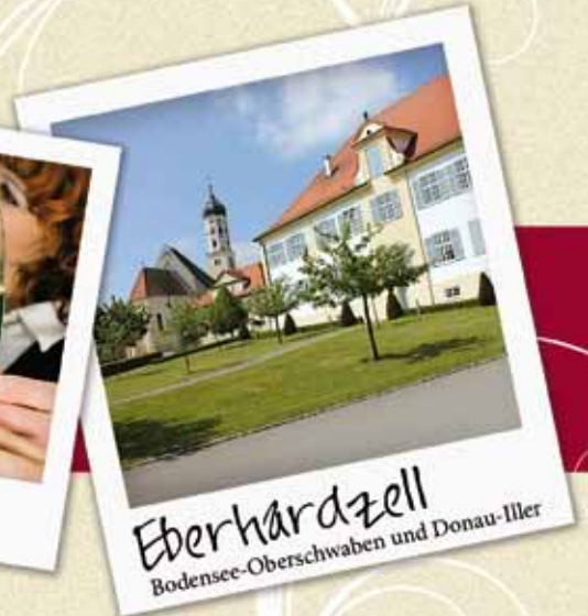
Eberhardzell Bodensee-Oberschwaben und Donau-Iller