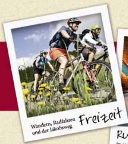
Wandern, Radfahren und der Jakobsweg Freizeit