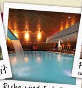
Ruhe und Erholung in einem der nahegelegenen Thermalbäder