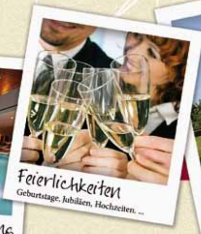
Feierlichkeiten Geburtstage, Jubiläen, Hochzeiten, ...